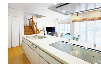
システムキッチンへのリフォーム