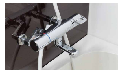
浴室水栓のみ交換