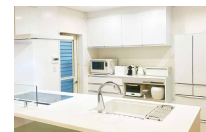
給排水工事を伴うキッチンリフォーム