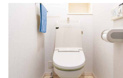
和式→洋式便器交換