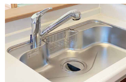
キッチン水栓単体の取り替え交換工事